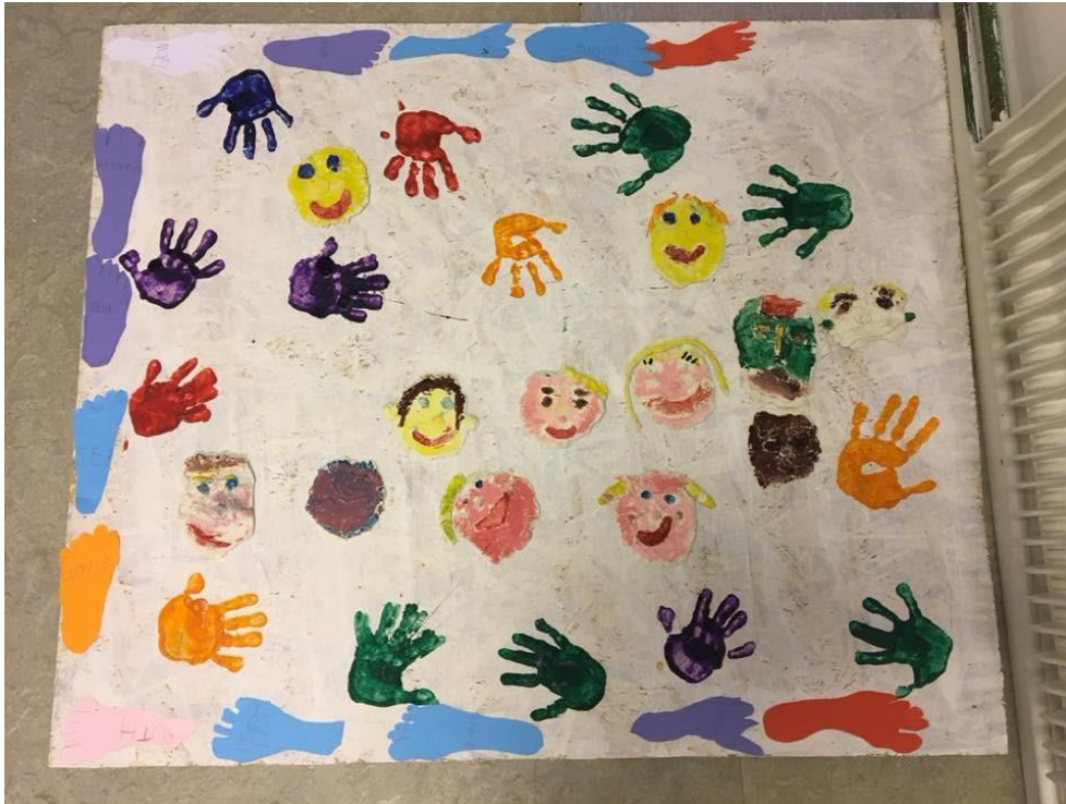
FN konstverk från Vindelälvsskolan F-2

Informationskanal för utbildningsverksamheten i Sorsele kommun